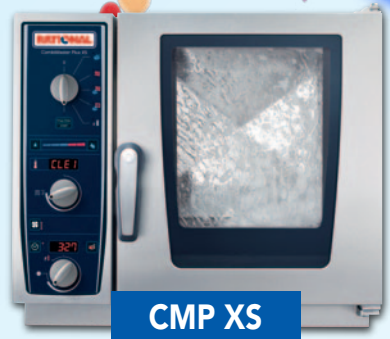
CMP XS Preis pro Stück

Ihren individuellen Preis bzw. Ihr Leasingangebot erhalten Sie vom Dagma-Fachgroßhändler.