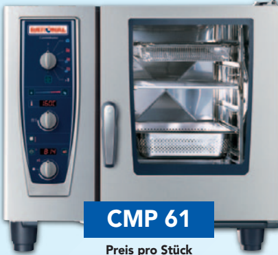
CMP 61 Preis pro Stück