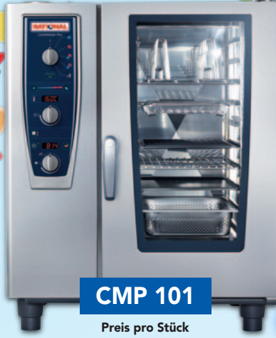
CMP 101 Preis pro Stück